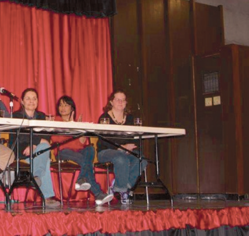
pour les travailleuses et les travailleurs

Tout d'abord, mentionnons que la dynamique au CASS a beaucoup changé depuis le congrès du Conseil central en mai 2013. L'arrivée d'un nouvel exécutif, d'un nouveau responsable politique et de nouveaux membres au CASS ont redynamisé son travail. Le CASS a notamment travaillé à l'élaboration d'une proposition pour la mise à jour de l'annexe sur les maladies professionnelles contenue dans la loi et cette proposition, bonifiée par les discussions au sein des instances de la CSN, a été adoptée par le Conseil fédéral de la CSN en mars 2014. Le Conseil fédéral est l'instance suprême de la CSN entre les congrès. Cette prise de position augmentera certainement le rapport de force des organisations ouvrières lorsque viendra le temps de discuter d'un nouveau projet de réforme de la loi.