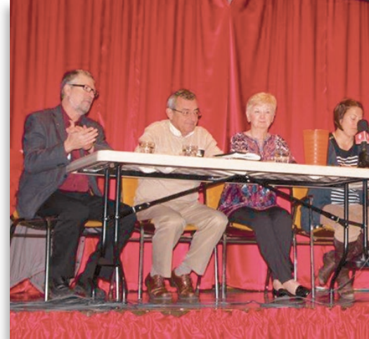
Conférence de presse de la Coalition La CSST pour les travailleuses et les travailleurs domestiques avec ses alliés syndicaux

L'autre élément à souligner concerne l'ATTAQ. En effet, l'an dernier nous