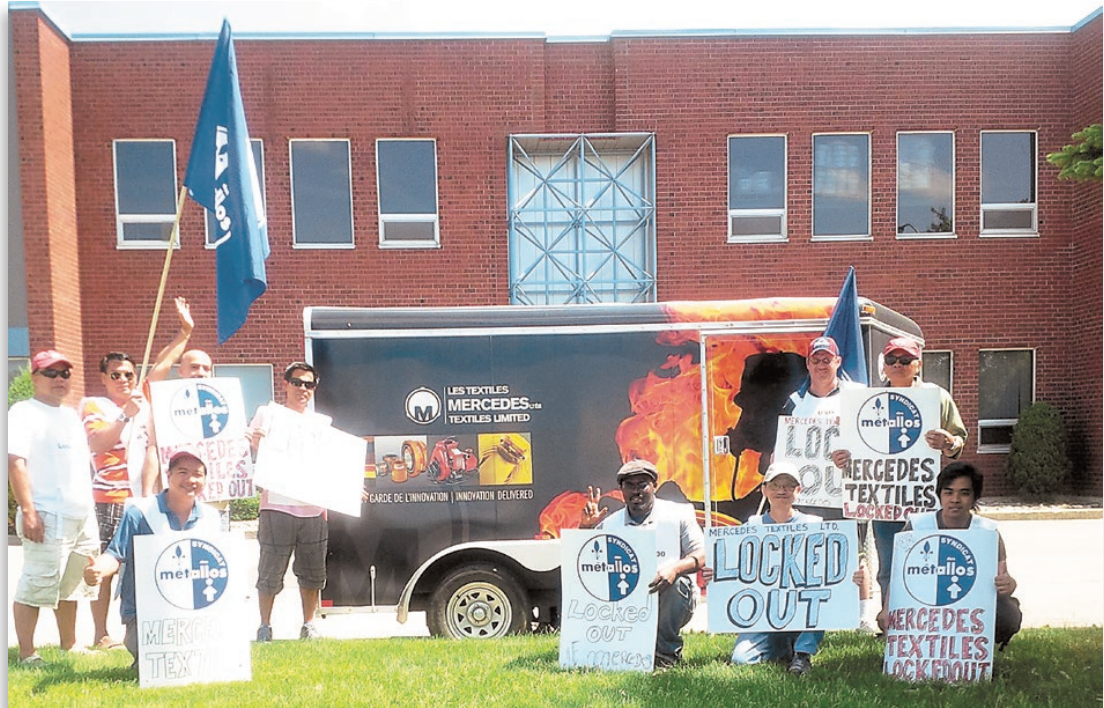
Quelques-uns des 44 employés de Mercedes Textiles en « lock-out »

Ces demandes de concessions, alors que la situation financière de l'entreprise